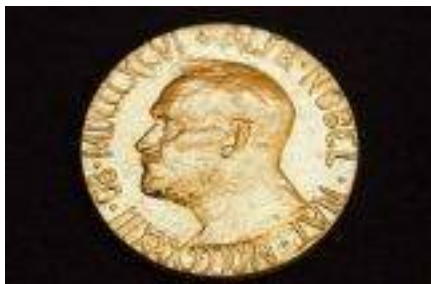
Médaille du prix Nobel de la paix, Maison de l'histoire européenne, Bruxelles

Organisez un débat entre vos élèves sur le thème "L'Union européenne méritait-elle le prix Nobel de la paix?" autour des documents de la ressource n° 7. Pour mieux articuler leur argumentation, vos élèves pourront tâcher de répondre aux questions-clés qui accompagnent les documents fournis. Séparez-les en deux groupes, dont l'un soutiendra la position "Oui, l'Union méritait le prix Nobel de la paix", et l'autre "Non, l'Union ne méritait pas le prix Nobel de la paix". Demandez à chaque groupe de désigner un porte-parole chargé de défendre le point de vue de son groupe lors du débat.