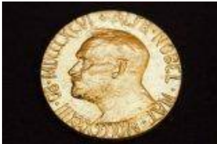
Medaille van de Nobelprijs voor de Vrede, Huis van de Europese geschiedenis, Brussel

Organiseer een debat tussen de leerlingen over het onderwerp "Was de uitreiking van de Nobelprijs voor de Vrede aan de Europese Unie terecht?". Maak daarbij gebruik van de documenten uit bron 8 . Om structuur aan te brengen in hun argumentatie kunnen de leerlingen proberen de belangrijkste vragen bij de documenten te beantwoorden. Verdeel de leerlingen in twee groepen. Een groep verdedigt het standpunt "De uitreiking van de Nobelprijs voor de Vrede aan de EU was terecht", de andere groep verdedigt het standpunt "De uitreiking van de Nobelprijs voor de Vrede aan de EU was onterecht". Vraag beide groepen een woordvoerder aan te wijzen die het standpunt van de groep tijdens het debat zal verwoorden.