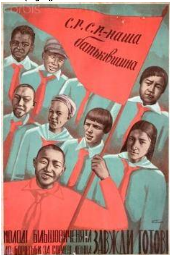
B. Bilotlskii sovietinės propagandos plakatas „SSRS“ (jaunimo kova už Lenino kelią)

Buvusioje Sovietų Sąjungoje propaganda buvo naudojama norint sukurti visų bendros sovietinės tapatybės vienijamų tautų federacijos iliuziją. Šiam plakate pavaizduoti jauni įvairios etninės kilmės Sovietų Sąjungos piliečiai.