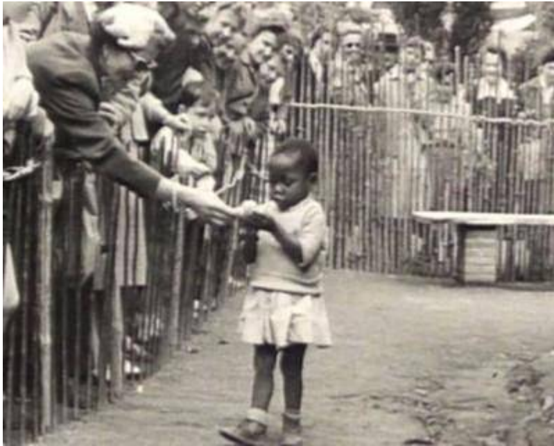
Menschenzoo in Brüssel, Belgien, 1958