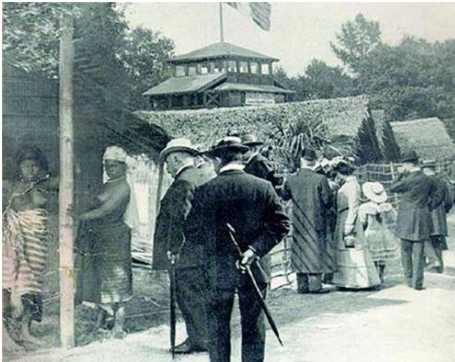
Ein sogenanntes „Negerdorf“

„Menschenzoos“ – auch Völkerschauen genannt – waren ein entsetzliches Phänomen, das in den letzten Jahrzehnten des 19. und den ersten Jahrzehnten des 20. Jahrhunderts in Westeuropa und Nordamerika verbreitet war. In diesen Ausstellungen wurden Angehörige unterworfenen fremder Völker in Gehege eingeschlossen und zur Schau gestellt. Die Völkerschauen zogen Millionen von Zuschauern an.