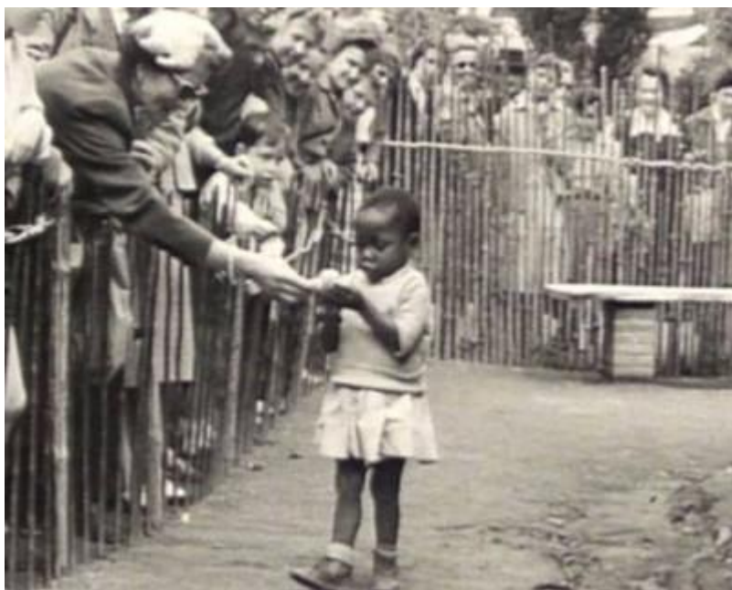
Ľudská zoológická záhrada v Bruseli, Belgicko, 1958