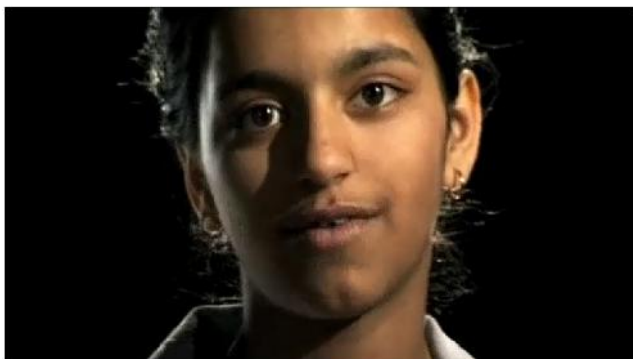
Laissez-les grandir ici

Věnujte se otázce, jak může vypadat v evropských zemích život migrantů, kteří nemají oficiální občanství, viz. www.undocumentary.org , a podívejte se na následující krátký film, v němž o své situaci vypovídají děti těchto migrantů bez náležitých dokladů k pobytu.