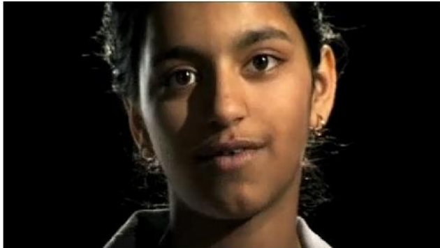
Laissez-les grandir ici

kansalaisuusasemaa? Tutustukaa www.undocumentary.org -sivustoon ja katsokaa seuraava lyhytelokuva, jossa puheenvuoron saavat tällaisten nk. paperittomien siirtolaisten lapset.